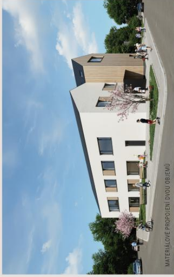
MATERIÁLOVÉ PRŮPJEKTY DVOU OBJEMŮ