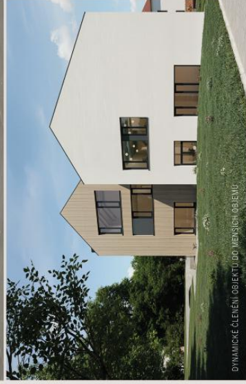
DYNAMICKÉ ČLENĚNÍ OBJEKTU DO MENŠÍCH OBJEMŮ