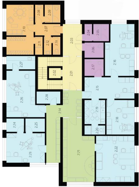
2. NADZEMNÍ PODLAŽÍ