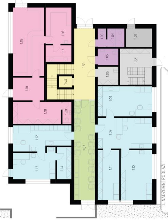
1. NADZEMNÍ PODLAŽÍ