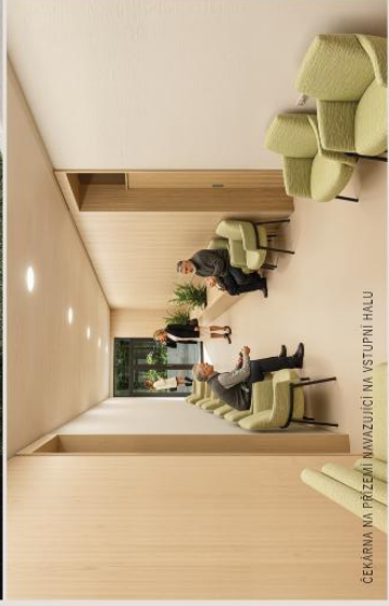
ČEKÁRNA NA PRŮZEMÍ NAVAZUJÍCÍ NA VSTUPNÍ HALU