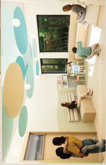
ČEKÁRNA PŘEDVÍRÍ S DESIGNOVÝM MÚZIKOVÝM PODHLEDĚM IMITOVÁNÍM ROZDÍLNÝCH