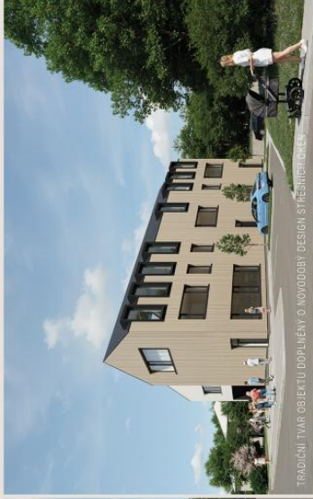
TRADIČNÍ TVAR OBJEKTU DOPLNĚNÝ O NOVODOBÝ DESIGN STRÁŠNICKÉ KRAJINY