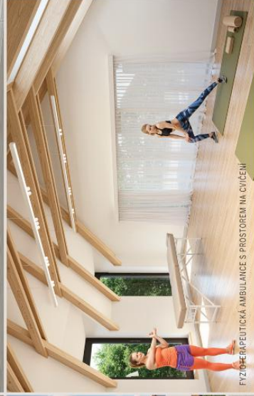
FYZIOTERAPEUTICKÁ AMBULANCE S PROSTOŘEM NA CVIČENÍ