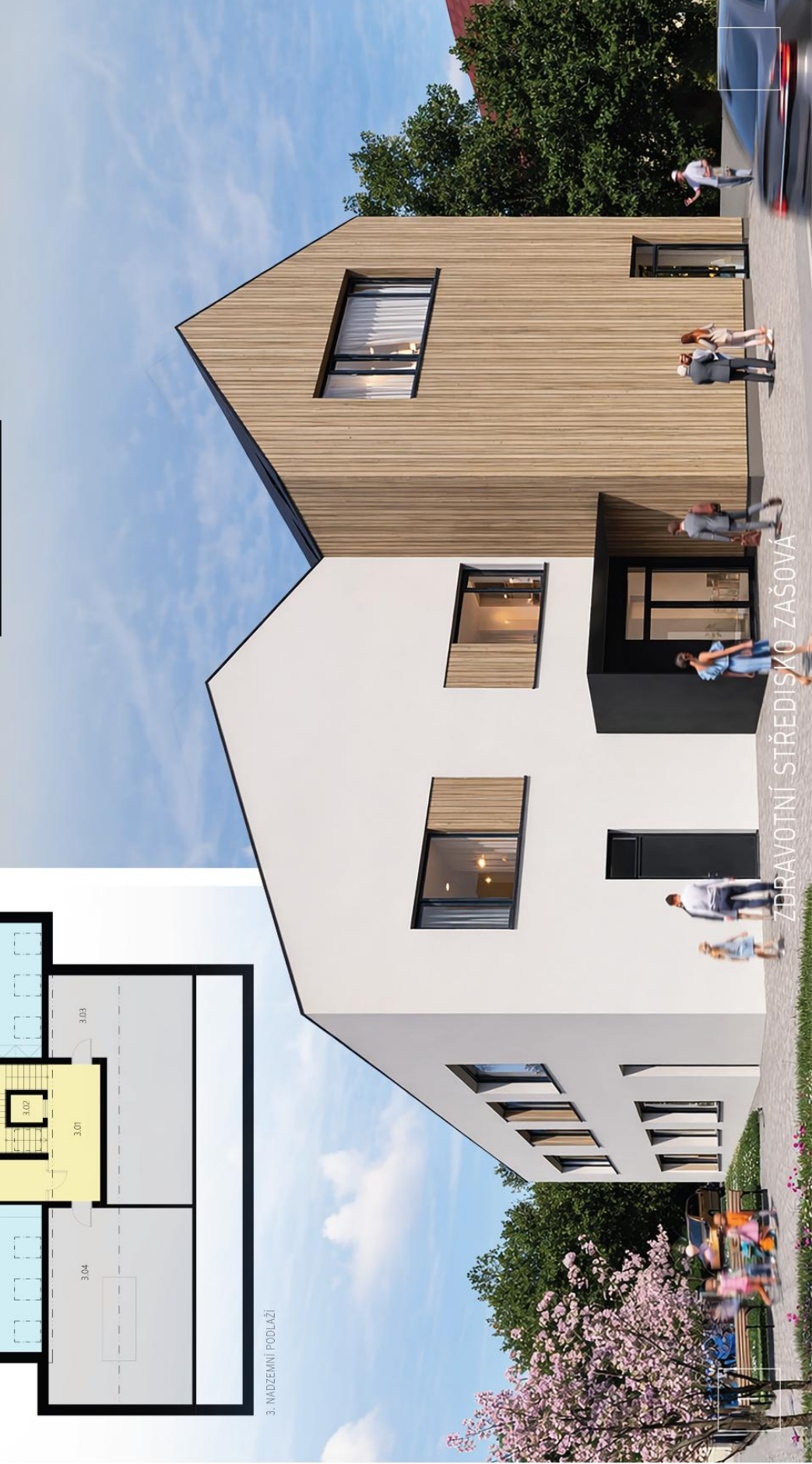
ZDRAVOTNÍ STŘEDISKO ZAŠOVA